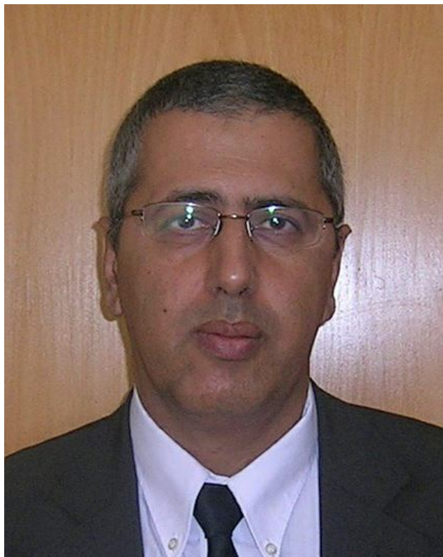
השופט יואל עדן.

הרב בן דוד טען בתגובה כי אין לו בכלל מפתח לשם וכי המקרה "לא היה ולא נברא". השופט דחה את טענתו וקבע כי עדותה של ל' היא עדות אמינה וקוהרנטית וגם אם היא לא דייקה בפרטים קטנים, זה דבר מקובל אצל קורבנות עבירות מין, וכתב "גם כאן אני נותן אמון מלא בעדותה המהימנה".