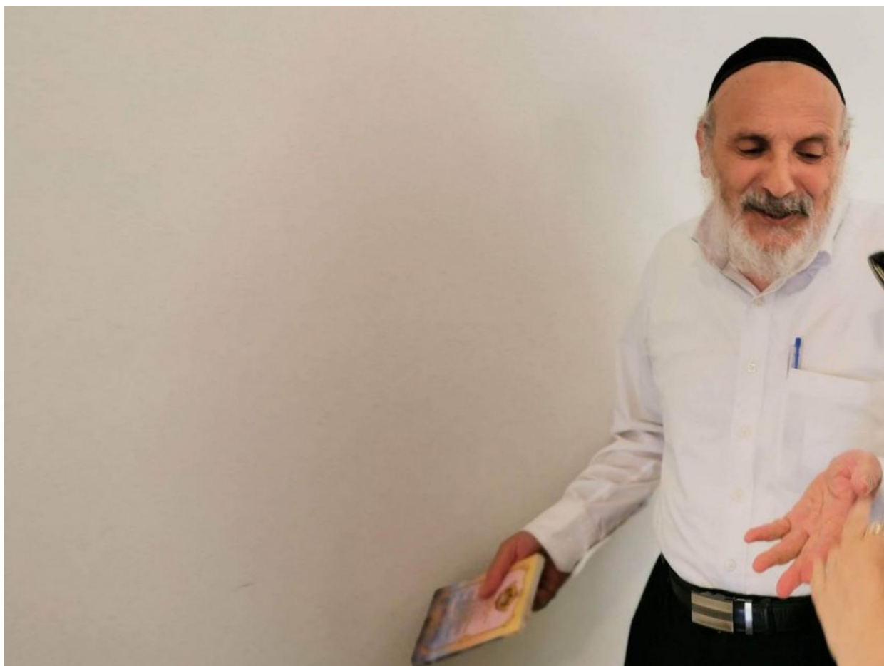
הרב יהודה בן דוד

“אני הלכתי למשרד שלו”, העידה ל’ בנוגע למקרה הראשון. “איכשהו זה הגיע לזה שאני הלכתי אחריו לחדר מטבעות שכאילו את צריכה ללכת קצת ואז הוא התחיל שם לגעת בי והתקרב אליי ולהצמיד את האיבר שלו לאיבר שלי וכאילו דחף אותו ושאל אותי אם אני רוצה לשכב איתו. הוא אחז את הראש שלי כי השפלתי את הראש שלי, הוא שאל: 'מה את רוצה שאני אעשה?' וזה ואז איכשהו אמרתי לו שאני צריכה ללכת. בהתחלה הסכמתי כי לא ידעתי מה זה ואז אמרתי לו שאני צריכה ללכת שוב כי יש לי לימודים והלכתי ובאותו יום לא הלכתי לבית הספר”.