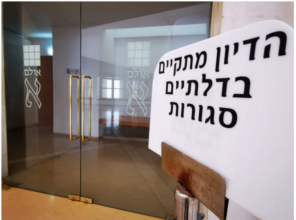
התיק של הרב התנהל בדלתיים סגורות