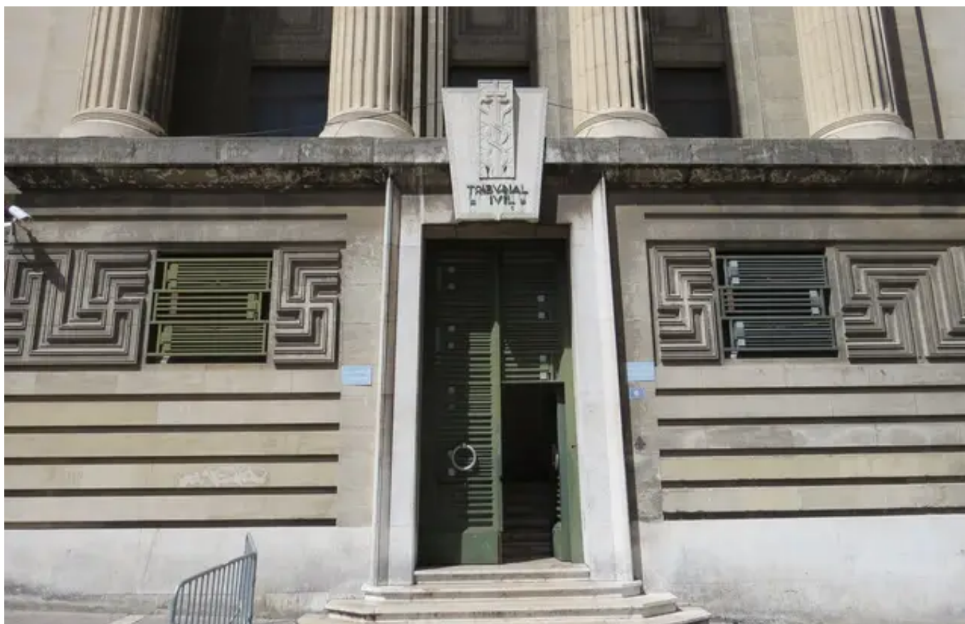
Le tribunal correctionnel de Marseille (Illustration)

C.C avec AFP | Publié le 09/03/17 à 11h24 — Mis à jour le 09/03/17 à 11h30