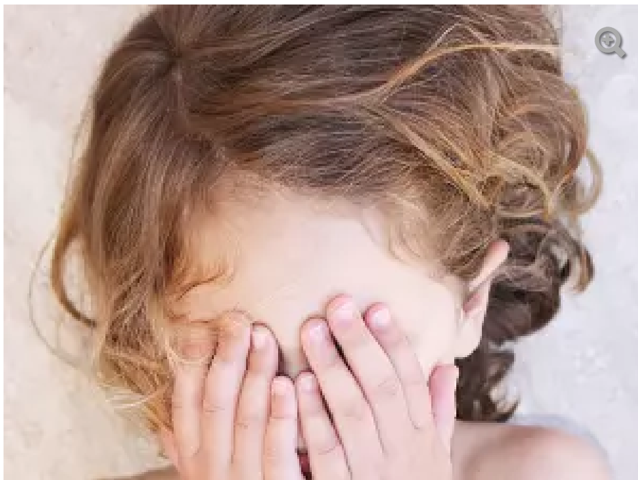
אחרי שהילדה עשתה כפי שהנחה אותה ושכבה עירומה על בטנה בספסל האחורי, הוא ניסה לאנוס אותה בכוח