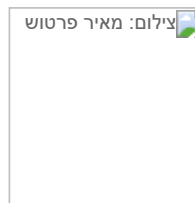
נאשם בסדרת תקיפות ושוחרר. אילוסטרציה צילום: מאיר פרטוש