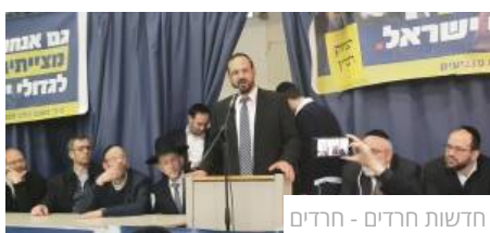
חדשות חרדים - חרדים

רביץ: "רציתם דמוקרטיה קיבלתם. כבדו את הצד המנצח"