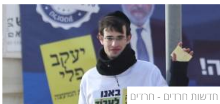
חדשות חרדים - חרדים