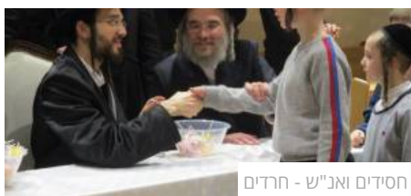
חסידיים ואנ"ש - חרדים

תיעוד: הביקור של נכד הרבי מבעלזא בלונדון