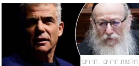
חדשות חרדים - חרדים

רביץ: "רציתם דמוקרטיה קיבלתם. כבדו את הצד המנצח"