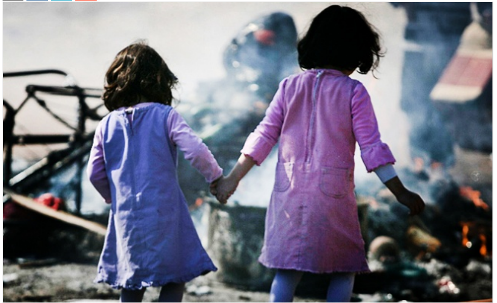
אילוסטרציה. למצלמות אין קשר לנאמר בכתבה