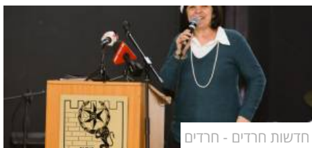
חדשות חרדים - חרדים