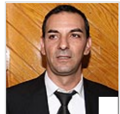
"עלילה של בני משפחת הכלה". עו"ד טולדו