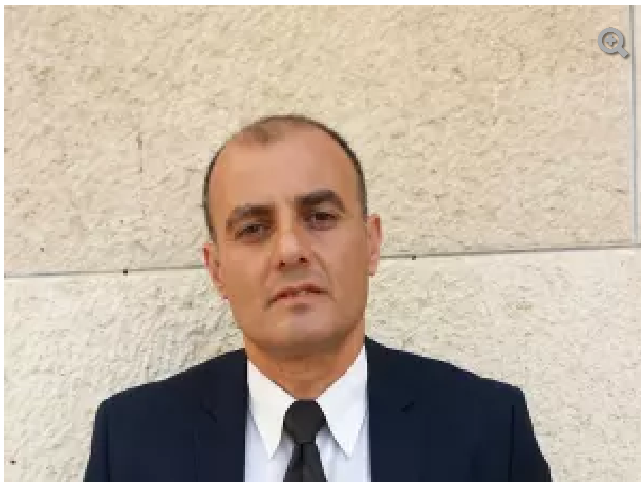
"בית המשפט היה קשוב לטענותינו". עו"ד איתן

האישום השלישי נגד פרי-משלנו התייחס לר', ילדה בגיל גן חובה, וממנו עלה כי פרי-משלנו הציע לה כסף וממתק אם תבוא לביתו. על פי אותו אישום פרי-משלנו דחף את הילדה לביתו תוך שהוא מכה בה בידו ולאחר מכן אף היכה בה במקל. ר' נפלה, ולאחר שקמה היכה בה פרי-משלנו פעם נוספת. ר' ניסתה לברוח, אך פרי-משלנו חסם אותה ברגליו ובעט בה ברגלו עד שנכנסה לביתו. לאחר מכן הוא נעל את הדלת, תפס בר' וזרק אותה בכוח למרכז החדר. פרי-משלנו התפשט וניסה לשכנעה להסיר את בגדיה,