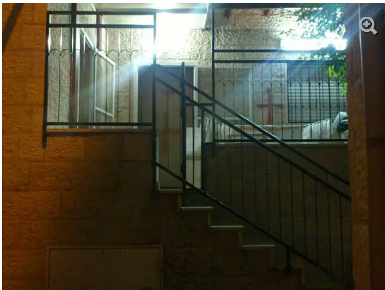
"שכונה מרובת אוכלוסין וצפופה בה יש קשרים והכרויות בין הורים, ילדים ומשפחות". נחלאות

יחד עם פרי-משלנו, תושב השכונה בשנות ה-40 לחייו, נעצרו בזמנו שני תושבים נוספים. אחד מהם, בנימין סץ (43), אף הורשע בחודש ינואר האחרון בביצוע מעשים מגונים ומעשי סדום בילדות וילדים בני חמש עד שמונה בשכונה. נגד התושב השלישי, הנאשם בביצוע מעשים מגונים, עדיין מתנהל משפט, אולם הוא שוחרר ממעצר.