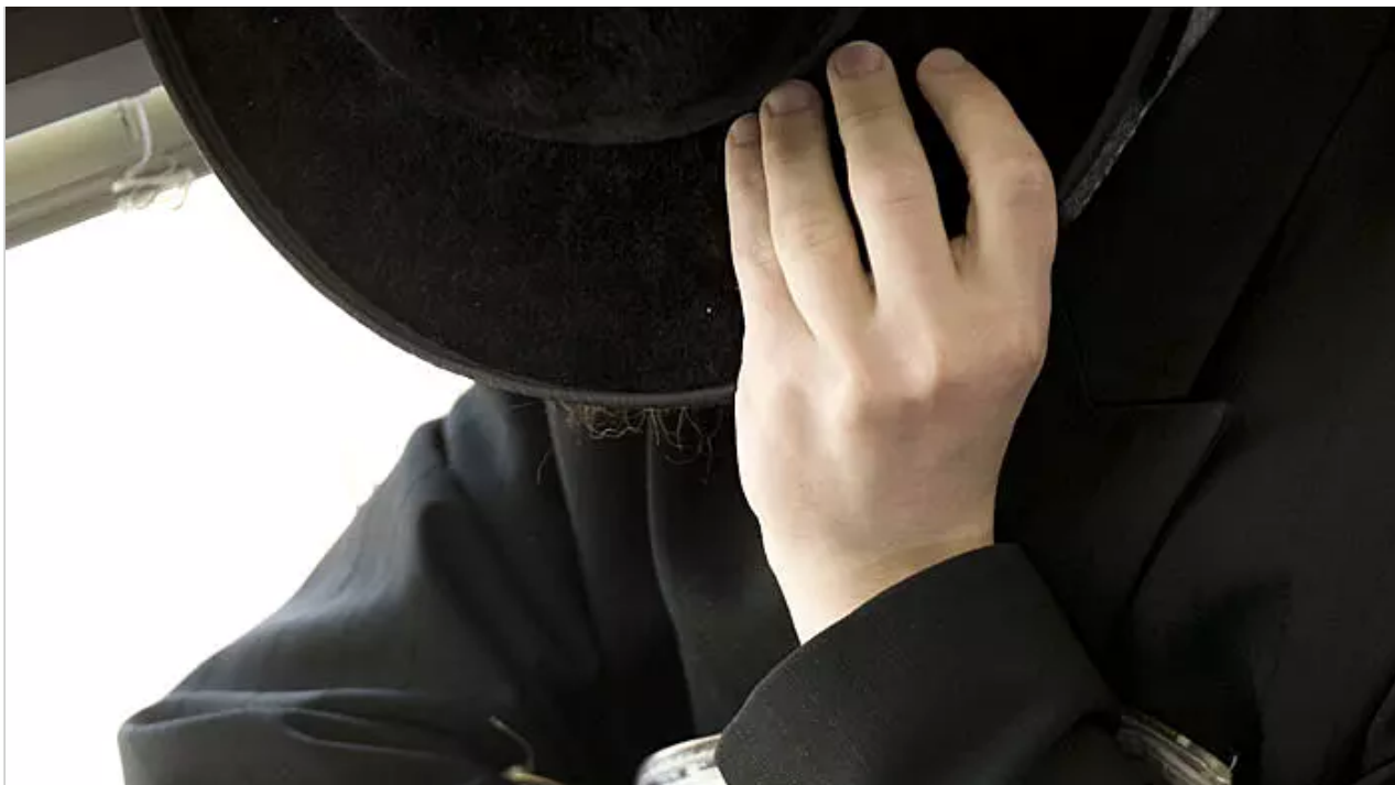
תפס את איבר מינו של המתלונן לשם גירוי מיני