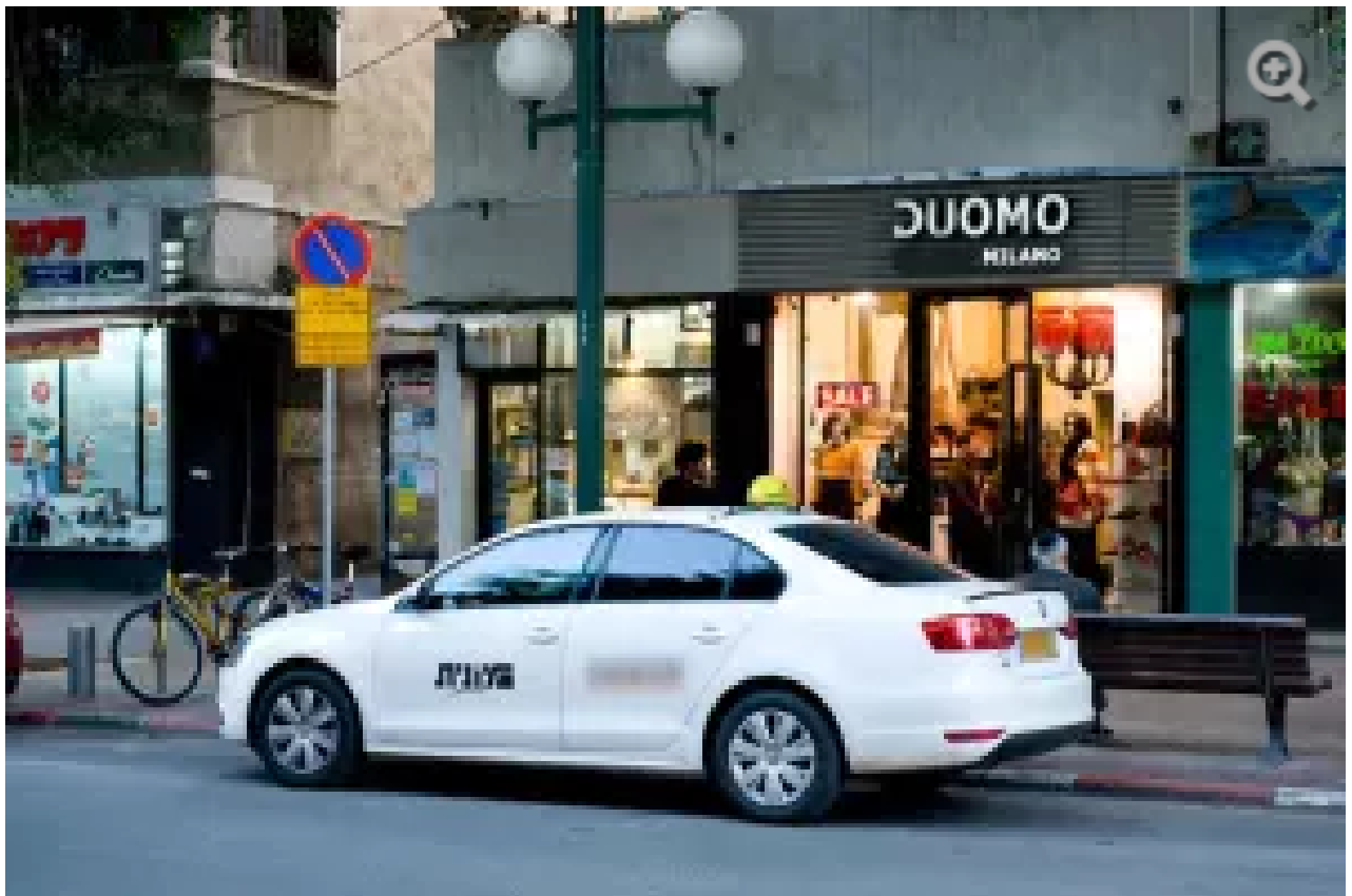
אחז בחצאיתה ומנע ממנה לרדת. מונית