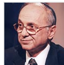
נאמן. המלצות חמות