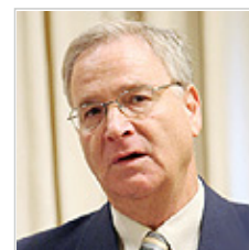
קדמן. אור ירוק לפושעים

רד לוביץ' | פורסם: 06.06.06 12:32 | Recommend 0