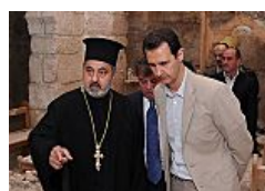
דאעש מפורר את סוריה,