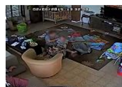
"אגרף בפנים". תיעוד: